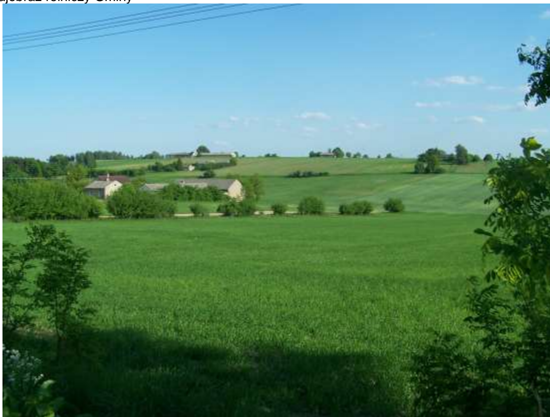
Fot. 1 Krajobraz rolniczy Gminy

Gmina Rogów jest gminą rolniczą. Dominujące w strukturze użytkowania gruntów użytki rolne zajmują ok. 63,6% powierzchni. Wśród użytków rolnych zdecydowanie przeważają grunty orne – zajmujące ok. 53,9% powierzchni użytków rolnych. Mniejszy udział w powierzchni Gminy mają lasy i grunty leśne – ok. 21,8% powierzchni Gminy.