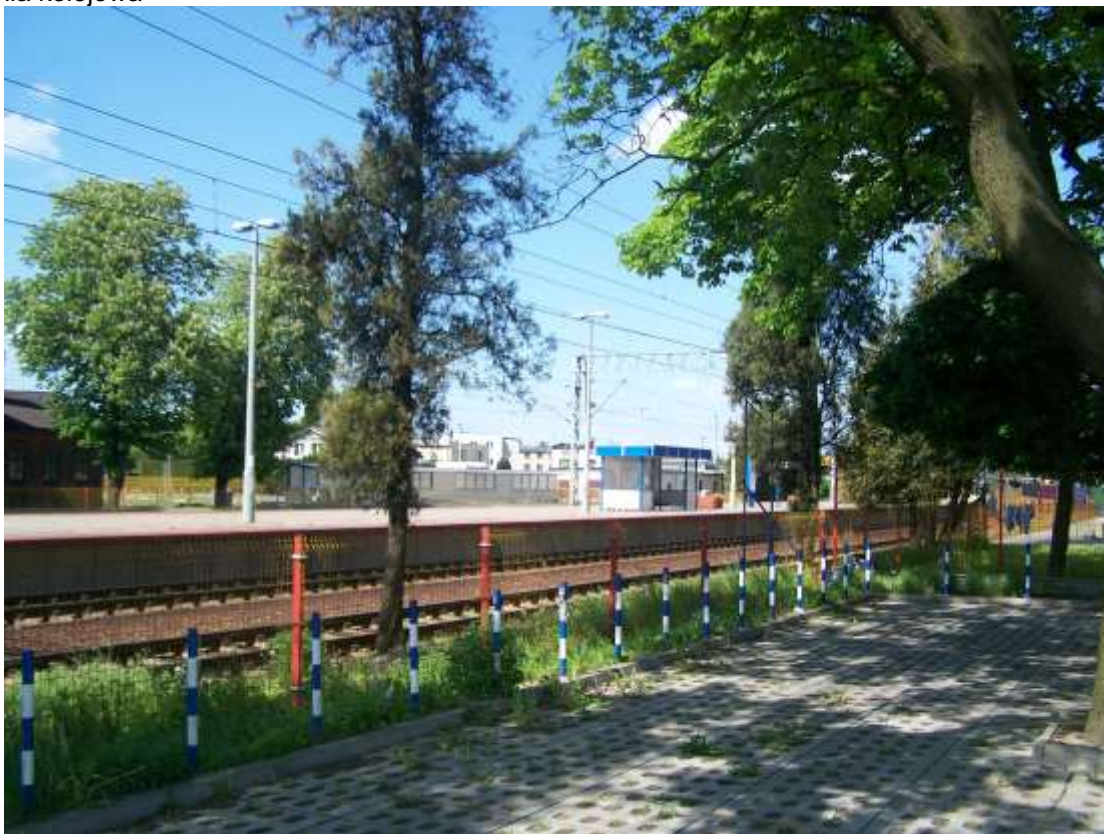
Fot. 9 Linia kolejowa