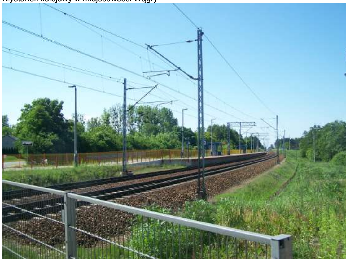
Fot. 10 Przystanek kolejowy w miejscowości Wągry

Przez teren Gminy przebiega normalnotorowa magistrala kolejowa Warszawa – Katowice. Przystanki kolejowe o funkcji pasażerskiej funkcjonują w: Przyłuku Dużym, Rogowie, Wągrach. Jest to kolej czynna, umożliwiająca podróż z Gminy m.in. do Skierniewic, Koluszek, Łodzi. Na terenie Gminy zatrzymują się jedynie pociągi osobowe z częstotliwością co około 1 godzinę.