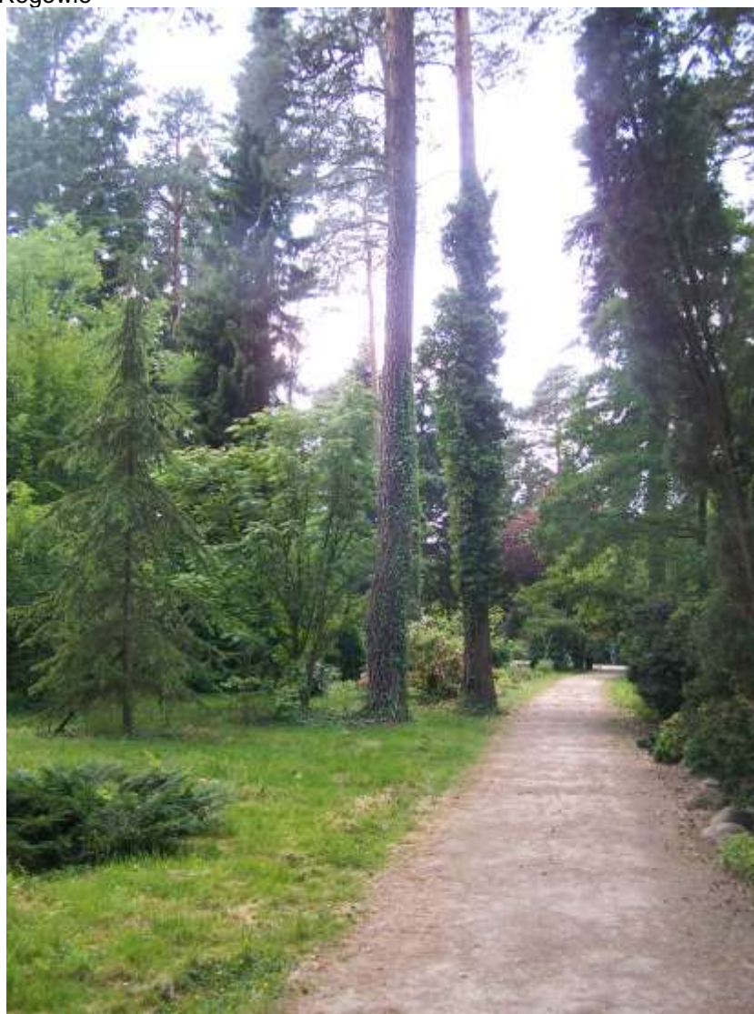
Fot. 5 Arboretum w Rogowie

Leśny Zakład Doświadczalny w Rogowie, należący do Szkoły Głównej Gospodarstwa Wiejskiego, a także część nadleśnictw: Brzeziny i Spała tworzą Leśny Kompleks Promocyjny „Lasy Spalsko-Rogowskie”, o powierzchni 31 259 ha. Kompleks ten został powołany Zarządzeniem Dyrektora Generalnego Lasów Państwowych z dnia 30 października 2002 roku (zmienione Zarządzeniem Dyrektora Generalnego LP z dnia 7 lutego 2005 r.). Leśne kompleksy promocyjne są obszarami funkcjonalnymi o znaczeniu edukacyjnym i społecznym, o szczególnym jednolitym programie gospodarczo-ochronnym. Jednostkami organizacyjnymi LZD w Rogowie są: Arboretum, Centrum Edukacji Przyrodniczo-Leśnej, Nadleśnictwo Rogów oraz Szkółkarski Ośrodek Szkoleniowy. Tereny LZD mają charakter parkowy, a kolekcje drzew i krzewów znajdujące się na jego terenie należą do najbogatszych i najciekawszych w Europie Środkowo-Wschodniej. Kompleks Arboretum tworzą: kolekcje roślin drzewiastych, leśne powierzchnie doświadczalne oraz Alpinarium, stanowiące unikalną kolekcję populacji roślin pochodzących z różnych stanowisk naturalnego występowania i różnych ogrodów. Znaczna część kompleksu udostępniana jest zwiedzającym. Istnieje tu również możliwość prowadzenia zajęć edukacyjnych dla młodzieży szkolnej.