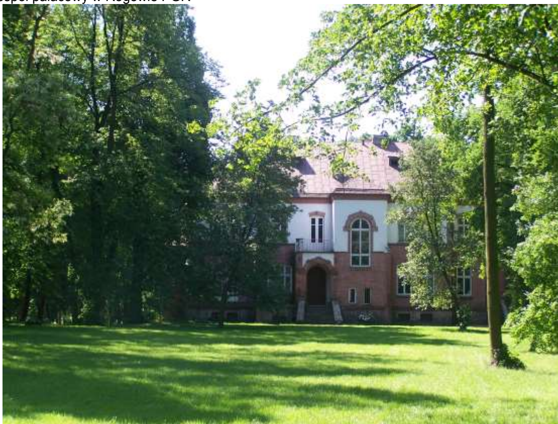
Fot. 6 Zespół pałacowy w Rogowie PGR