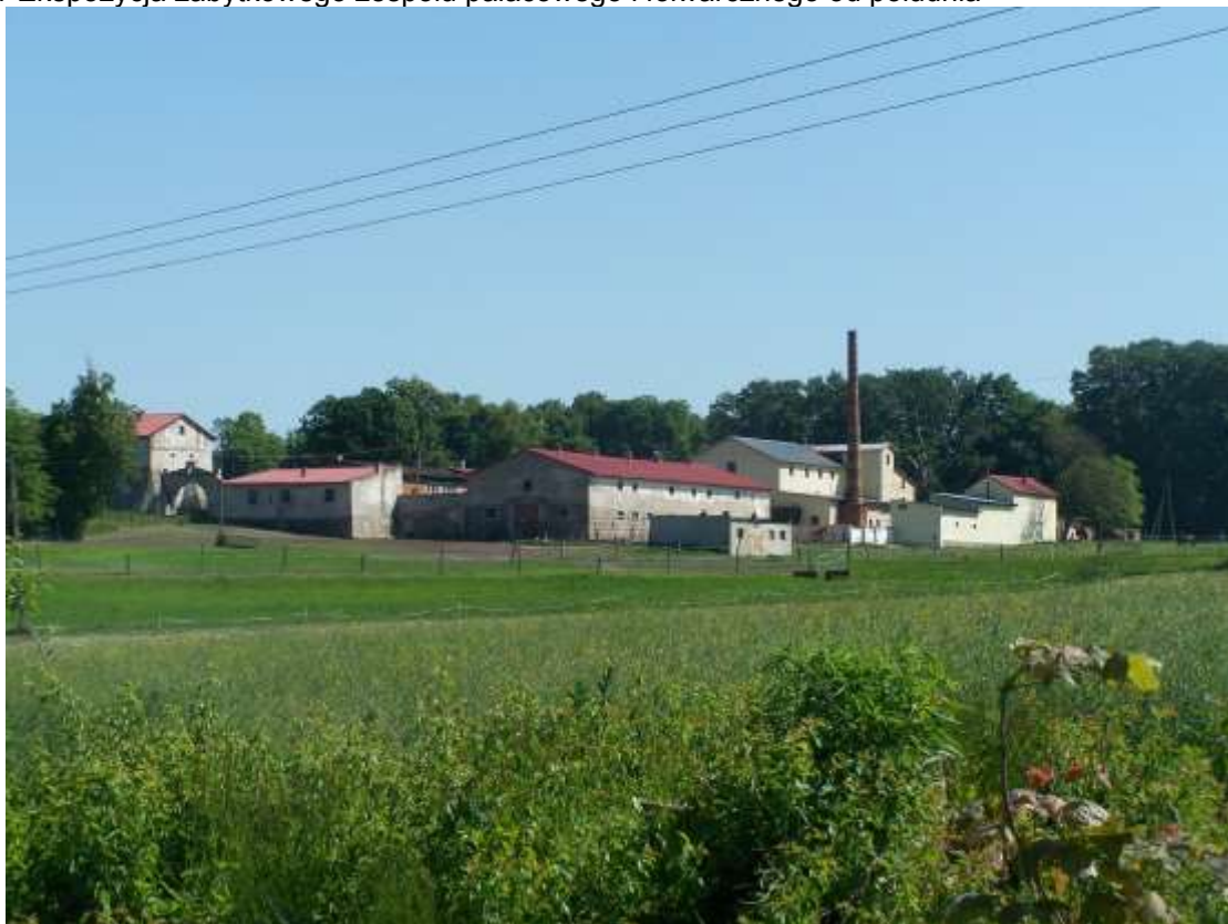
Fot. 11 Ekspozycja zabytkowego zespołu pałacowego i folwarcznego od południa