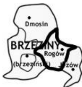
Mapa. Położenie Gminy Rogów w powiecie brzezińskim