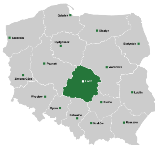
Mapa 1. Polska z zaznaczonym województwem łódzkim

Miejscowość Przyłek Duży położona jest we wschodniej części Gminy Rogów. Gmina Rogów położona jest w powiecie brzezińskim, województwie łódzkim.