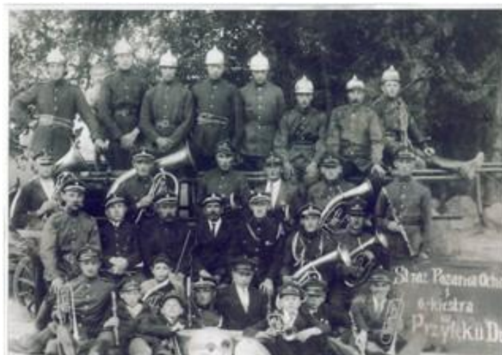
Fot. Straż Pożarna i orkiestra w Przyłęku Dużym – zdjęcie archiwalne 1

OSP w Przyłęku Dużym aktywnie realizuje nałożone na OSP zadania, utrzymując stałą, wysoką jakość usług strażackich o czym świadczyć może stałe utrzymywanie od siedemnastu lat I miejsca w gminnych zawodach strażackich.