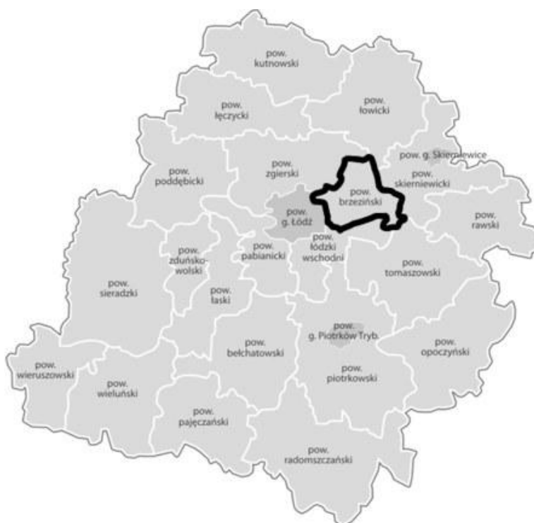
Mapa. Powiat brzeziński w województwie łódzkim